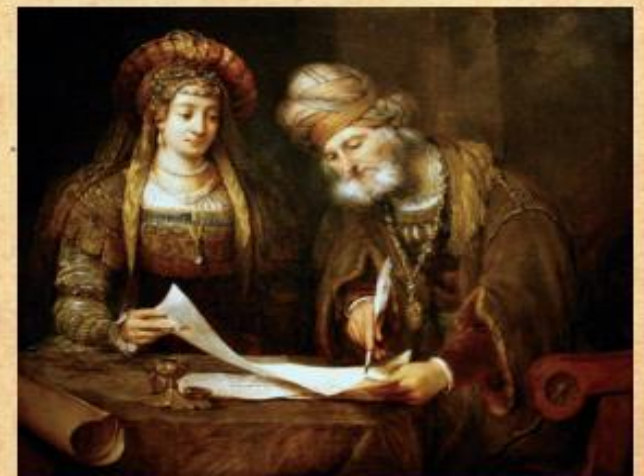
אסתר ומרדכי כותבים את סיפור פורים Aert de Gelder 1675