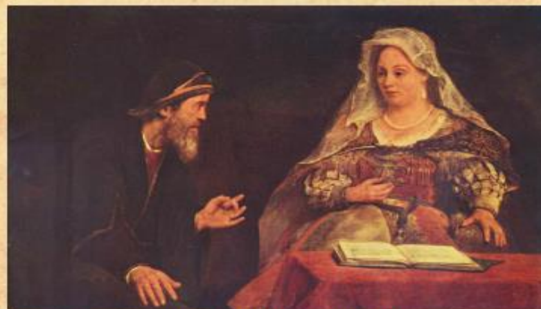
אסתר ומרדכי, 1685 - Aert de Gelder

ככל אשר צוהו עליו אסתר - אסתר כבר לא אשה טפשה כל כך.. ומרדכי קיבל ציווי!