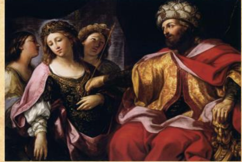
אסתר לפני אחשוורוש - Giovanni Andrea Sirani, 1630