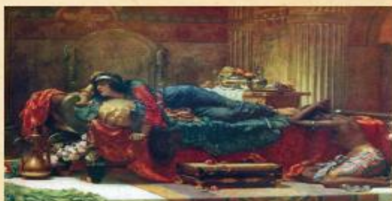
משתה הנשים של וּשְׁתִי - Ernest Normand, 1890

חֹר בְּרַפֶּס וּתְכֵלֶת אַחוּז בְּחַבְלֵי-בוּץ וְאַרְגָּמָן עַל-גְּלִילֵי כֶסֶף וְעַמּוּדֵי שֵׁשׁ מְטוֹת זָהָב וְכֶסֶף עַל רִצְפַת בַּהֲט־וְשֵׁשׁ וְדָר וְסַחֲרֹת. וְהִשְׁקוֹת בְּכָלֵי זָהָב וְכָלִים מְפֹלִים שׁוֹנִים וַיֵּין מַלְכוּת רַב כֶּיֶד הַמֶּלֶךְ. וְהִשְׁתִּיָּה כְּדַת אֵין אֹנֶס כִּי-כֵן יִסַּד הַמֶּלֶךְ עַל כָּל-רַב בֵּיתוֹ לַעֲשׂוֹת כְּרָצוֹן אִישׁ-נְאִישׁ. גַּם וַשְׁתִּי הַמֶּלֶכָּה עָשְׂתָה מִשְׁתָּה נְשִׁים בֵּית הַמַּלְכוּת אֲשֶׁר לַמֶּלֶךְ אֲחַשְׁוֵרֹשׁ