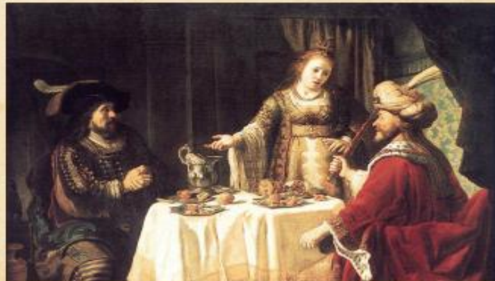
אסתר מזמינה את המן ואחשוורוש למשתה, Jan Victors, 1640

והמלך קם בחמתו ממשתה היין אל- גנת הביתו והמן עמד לבקש על-נפשו מאסתר המלכה כי ראה כי- כלתה אליו הרעה מאת המלך. והמלך שב מגנת הביתו אל-בית משתה היין והמן נפל על-המטה אשר אסתר עליה ויאמר המלך הגם לכבוש את-המלכה עמי בבית הדבר יצא מפי המלך ופני המן חפו . ויאמר חרבונה אחד מן-הסריסים לפני המלך גם הנה- העץ אשר-עשה המן למרדכי אשר דבר-טוב על-המלך עמד בבית המן גבה חמישים אמה ויאמר המלך תלהו עליו. ויתלו את-המן על-העץ אשר-הכין למרדכי וחמת המלך שככה .